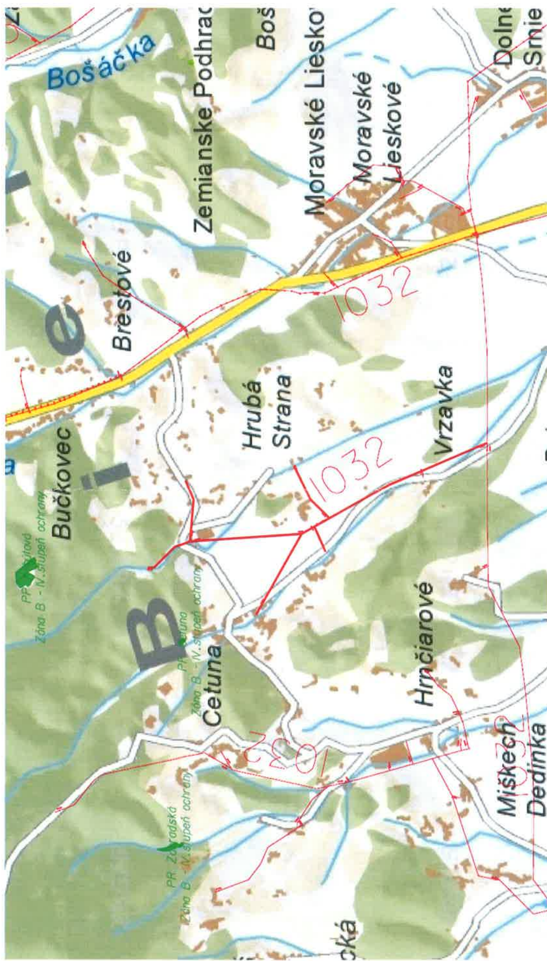
VN 1032 Bzince pod Javorinou / prípojky pre TS Hrubá Strana, Cetuna a Podvišňové